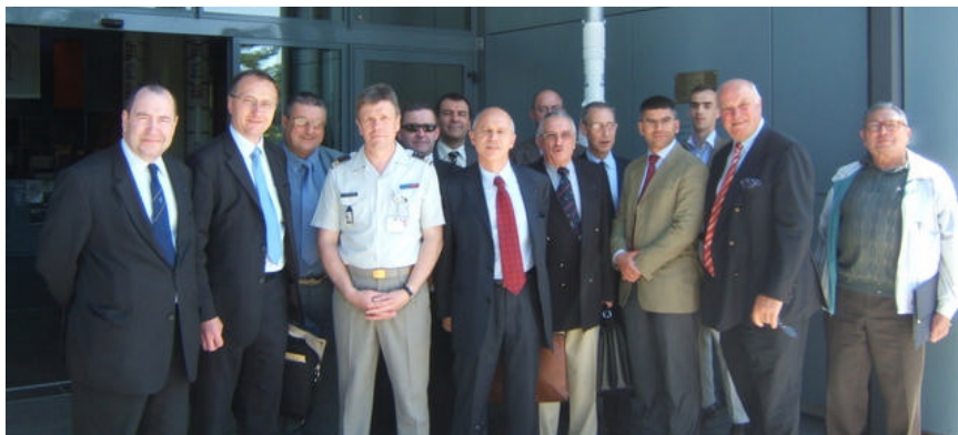
Les participants à l'AG, devant l'entrée du Musée des Transmissions

La première est de rayonner et faire rayonner l'armée de Terre dans la société civile. Pour le recrutement de nouveaux réservistes dans la société civile, après la disparition du vivier issu du service national, mais aussi pour faire entendre la voix des réservistes dans le monde politique. Et par exemple s'étonner que le décret d'application de la nouvelle loi sur les réserves, votée il y a presque deux ans, n'ait toujours pas vu le jour. (suite page 3)